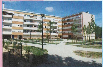
La Cour du 2 au 12 Eisenhower réaménagée

Depuis août 2013, Reims habitat, accompagné et du Cabinet Manière Mazocky Architecture, p végétalisation de l'esplanade et de la cour Eisenh