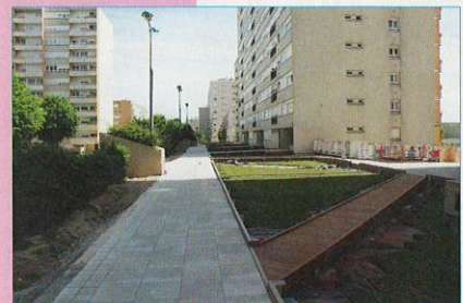
Lesplanade Eisenhower avec son nouveau cheminement piéton

Ces fru est cer de pai acc on L'ét am La suc sur de gra che De dal pe Le ap de: De êtr Eis et L'et ter